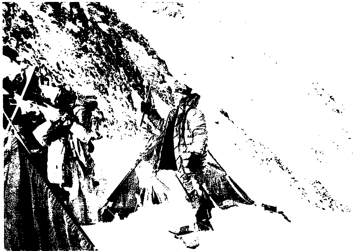
Лагерь на высоте 6900 метров.

Вылетаю с первым рейсом. Внизу проплывают безжизненные склоны предгорьев Центрального Тянь-Шаня. Остался позади Иссык-Куль. Пролетаем над Чон-Ташем, справа проплывает пик Нансена, внизу начинается бескрайняя ледяная река в разрывах и трещинах — ледник Иньльчек. Вертолет закладывает крутой вираж, и вот уже на правой морене ледника Дикий, впадающего в ледник Южный Иньльчек, красными пятнышками виднеются палатки экспедиции московского «Буревестника». С первого захода опускаемся недалеко от палаток прямо на неровный волнистый лед. Вертолет, зависнув в воздухе, разворачивается на девяносто градусов и аккуратно приседает на ледяной гребень. Винт продолжает вращаться, поддерживая машину на весу. Все восхищены мастерством нашего